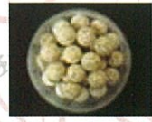
人工北投石 (玉川温泉 湯の花セラミック)