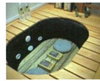
玉川温泉 (北投石盤癒)