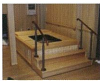
ステップ・手すり ※①⑥