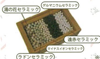
湯の花セラミック ゲルマニウムセラミック 遠赤セラミック マイナスイオンセラミック ラドンセラミック