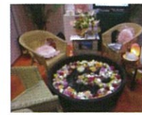
アルカリ水(美湯) 濃縮温泉水など