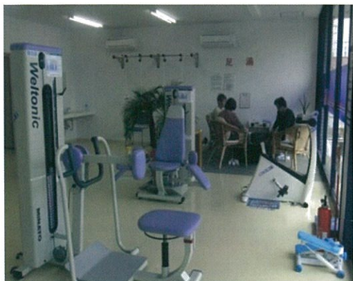
(リハビリ型デイサービス)