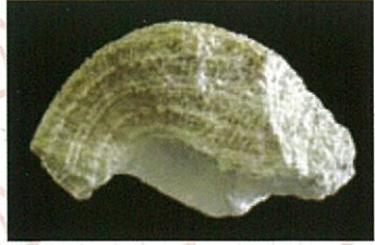
北投石 特別天然記念物

しかし、玉川温泉から析出された湯の花を精製し利用することにより、人工北投石（玉川温泉湯の花セラミック）ができるのです。この人工北投石を大量に使用したのが「足温浴」です。