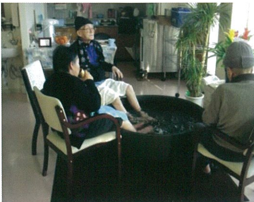
(デイサービス・ショートステイ)