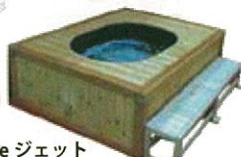
足湯 De ジェット